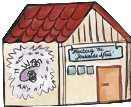
① Herberg 'De Jeukende Neus'

Kleur de avonturen in die je hebt overwonnen!