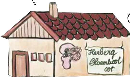
④ Herberg 'Bloemkooloor'