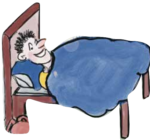
⑥ Veilig thuis